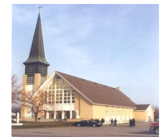
Saint-Nom-de-Jésus 825, rue Principale, Beresford Messe dimanche 9 h 30