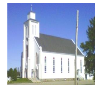
Sainte-Thérèse-d’Avila 1746, Route 322, Robertville Messe samedi 19 h