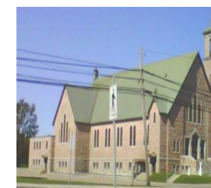
Saint-Polycarpe 598, rue Principale, Petit-Rocher Messe dimanche 11 h

Veillez noter que le bureau paroissial sera fermé le mardi 29 janvier de 13 h 00 à 16 h 30