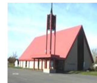
Saint-Vincent-de-Paul 422, rue Principale, Pointe-Verte Messe samedi 16 h