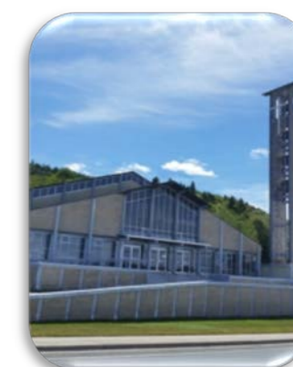
Notre-Dame-de-Lourdes Mission : 1860 Paroisse : 1913