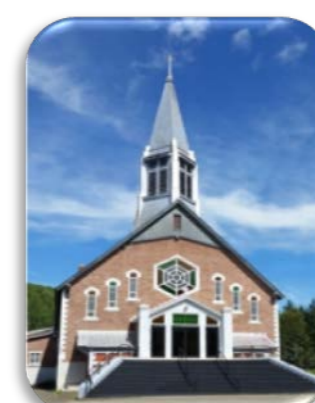
Notre-Dame-du-Sacré-Cœur Mission : 1890 Paroisse : 1907