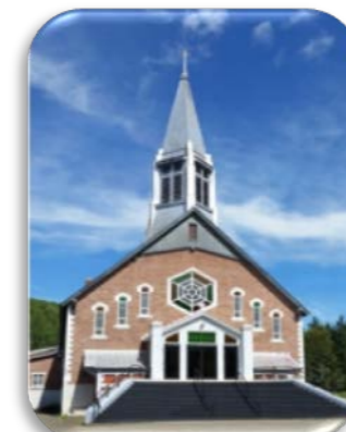
Notre-Dame-du-Sacré-Cœur Mission : 1890 Paroisse : 1907