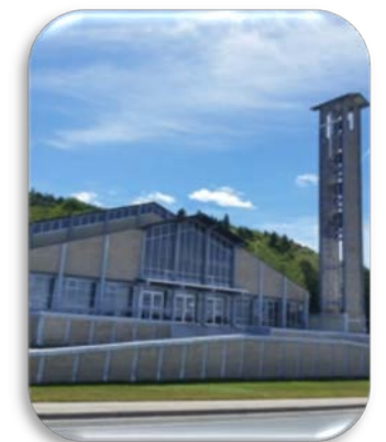
Notre-Dame-de-Lourdes Mission : 1860 Paroisse : 1913